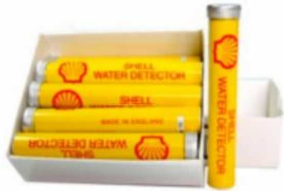
SHELL WATER DETECTOR